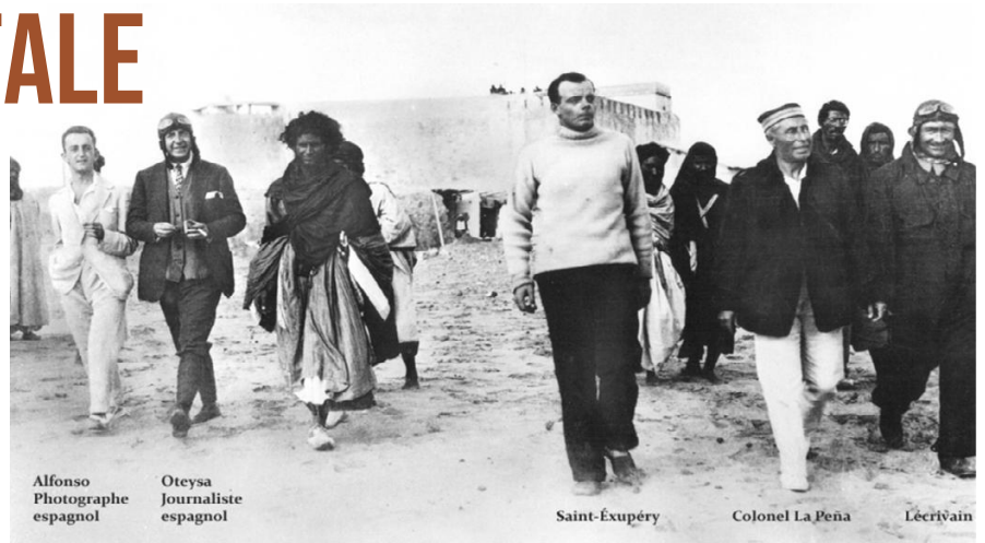
Alfonso Photographe espagnol