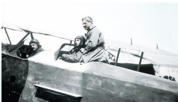
Latécoère – Beauté - Massimi

Casablanca et ses boîtes de nuit, Agadir et son quartier réservé, le fort Juby et le pénitencier militaire, Villa Cisneros et sa garnison espagnole sont les différentes étapes de ce raid. Pendant son voyage et aux escales, Kessel apprend à connaître les pionniers de l'aviation civile parmi lesquels comptaient Mermoz et Saint-Exupéry. Chaque semaine, ils accomplissaient un tour de force pour apporter les sacs postaux à bon port, au péril de leur vie.